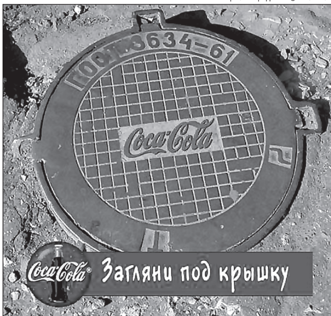
рис. Роберт Демкин © obx.exler.ru

Компания производитель Unilever: Lipton (чай); Brooke Bond (чай); "Беседа" (чай); Calve (майонез, кетчуп); Rama (масло); "Пышка" (маргарин); "Делми" (майонез, йогурт, маргарин); "Альгида" (мороженое); Knorr (приправы).