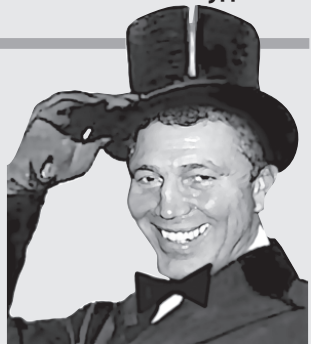
гим» для херсонцев мэром, когда платя высокие тарифы